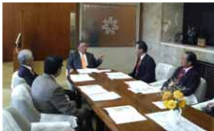
後志議長と議長室にて釣部前議長に支庁存続要望に同行。