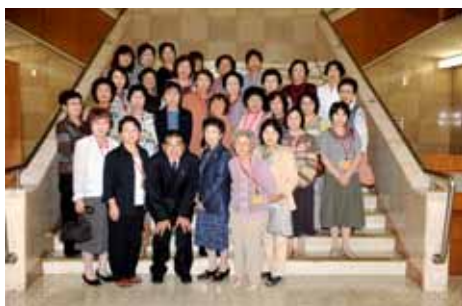
代表質問の応援に駆けつけていただいた女性部の皆さん、ありがとうございました。