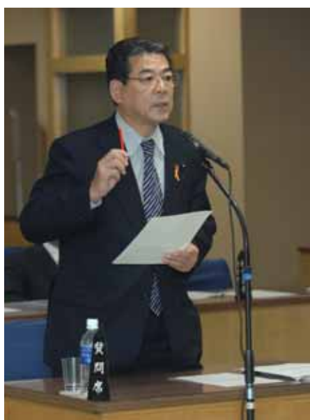
決算特別委員会で産消協働推進、地域産業おこしと人づくりについて質問、常に「後志の振興」を念頭に置き頑張ります。